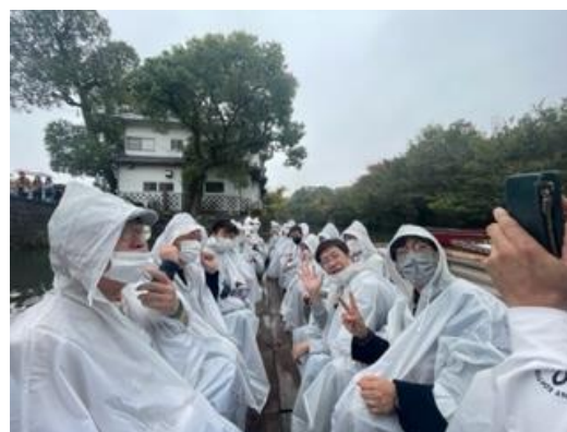
「親睦旅行 in 福岡」