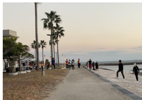
「焼野海岸の夕陽↑ 第5回スマイルコースト・ウォーク 出発式&ゴール→」