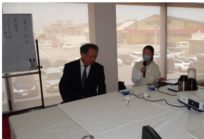
サビエル高校 インターアクトクラブ