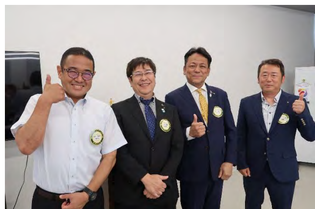
バッヂ交換・新旧会長幹事交代