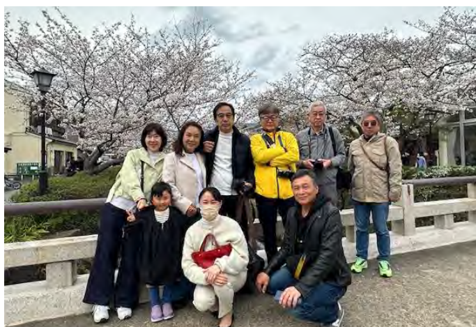
日時：2025年3月29日（土）14時より 場所：一の坂（山口市） 参加数：9名