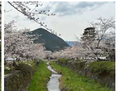
桜の写真